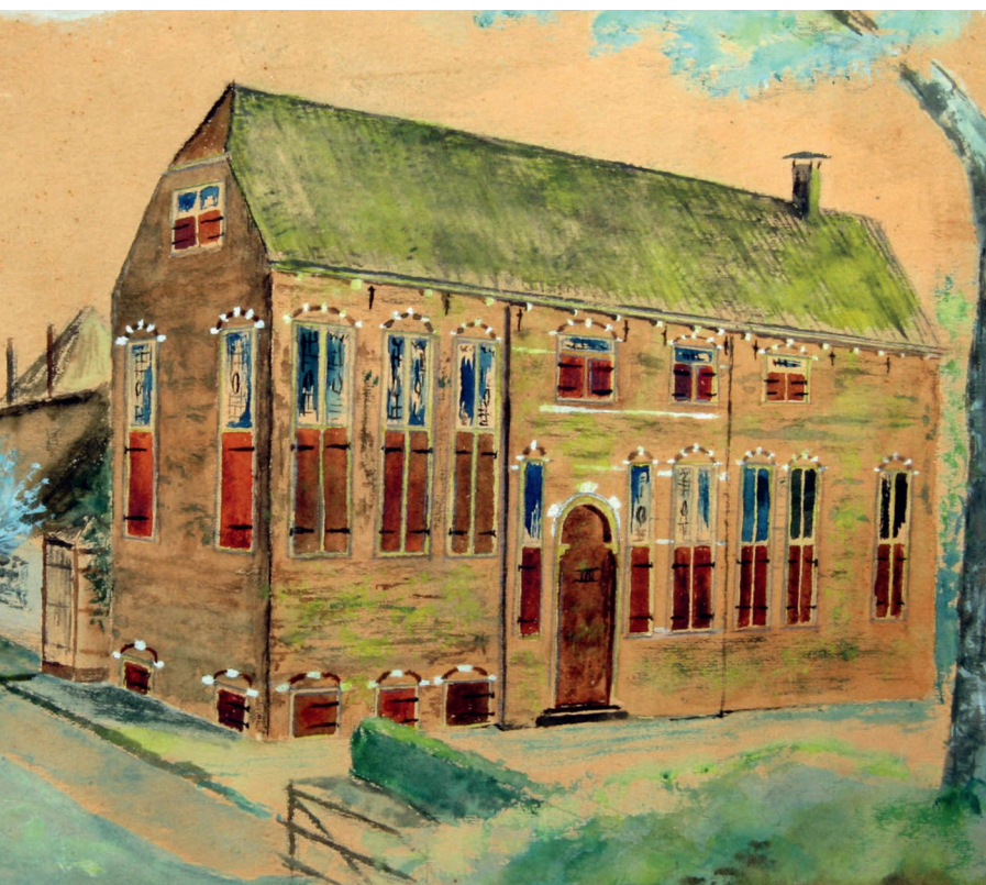
Ingekleurde tekening van het hoofdgebouw van de buitenplaats Hodenpijl, maker onbekend, 1823

boerderij over naar haar broer Hillebrandt van Wouw, die gehuwd was met Catharina van de Graeff. Op 12 maart 1690 sloot hij een nieuwe huurovereenkomst met pachter Cornelis Leendertsz. Uijtenbroek, boer en schepen van Hodenpijl. Na de dood van Hillebrandt in 1691 werden zijn kinderen en kleinkinderen erfgenamen van het buitenhuis en de boerderij. 11