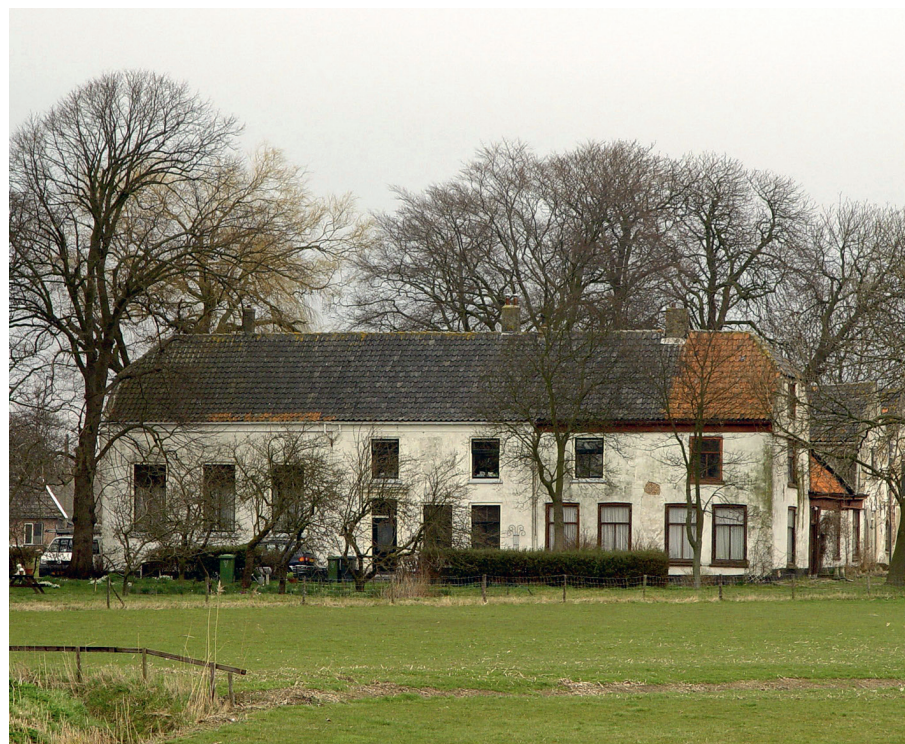
De buitenplaats Hodenpijl met bijgebouwen, waaronder twee pakhuizen.

De kopers waren Willem van den Bosch, meestertimmerman, Harmanus Grosman, hospes (herbergier) en Johannis Tukker, meesterwagenmaker, allen uit Schipluiden. Het ging om een totaalbedrag van 12.000 gulden en 600 gulden bijkomende kosten. Mogelijk kochten deze welgestelde ambachtslieden het bezit om ermee te speculeren. In ieder geval wisten ze geen nieuwe stedelijke familie voor het complex te interesseren. 18 Twee jaar later kocht Jan van den Bosch, landbouwer uit Schipluiden, voor 11.000 gulden het gehele bezit. 19 In 1765 en 1766 werd de verponding voor respectieve-