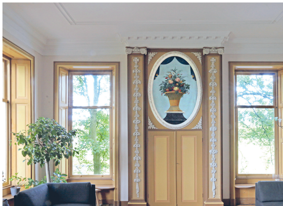
De zaal van de voormalige buitenplaats Hodenpijl.